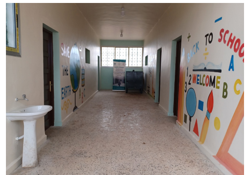
Photos avant-après d'un projet de réhabilitation d'une école à Alep, Syrie.

« Nous rentrons d'Alep après une visite sur le terrain et je dois dire que l'impact de ce projet est vraiment remarquable et que nous en sommes profondément reconnaissants. Le fait d'avoir été le témoin direct de cette incroyable transformation est profondément gratifiant. À l'école Tal Bajer, l'impact positif de nos efforts est particulièrement évident. L'école est devenue un havre de paix pour les enfants. Le modeste bâtiment s'impose comme le seul espace vivant et plein de couleurs au sein d'un village qui a été en grande partie détruit, laissant peu d'espoir à la communauté touchée. L'école a rassemblé la communauté, dont des enfants aussi jeunes que ceux de la huitième année qui envisagent déjà un avenir meilleur.